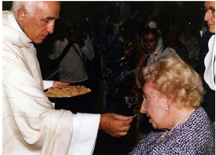
El vínculo de la Casa Real siempre permaneció vivo. La fotografía muestra a S.A.R. D a María de las Mercedes, comulgando el 15 de agosto de 1994.