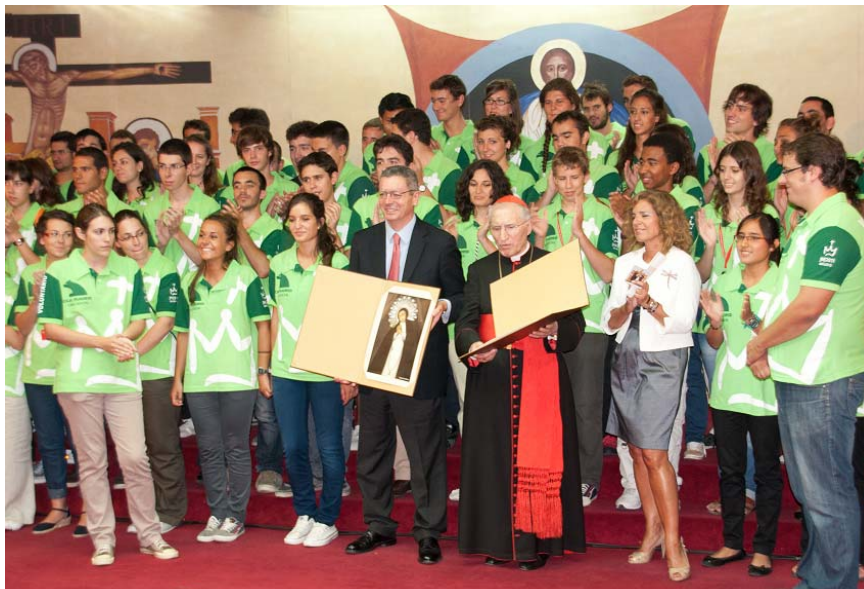
Jóvenes de la Parroquia con el Sr. Arzobispo y autoridades el 15 de agosto de 2011 (JMJ)