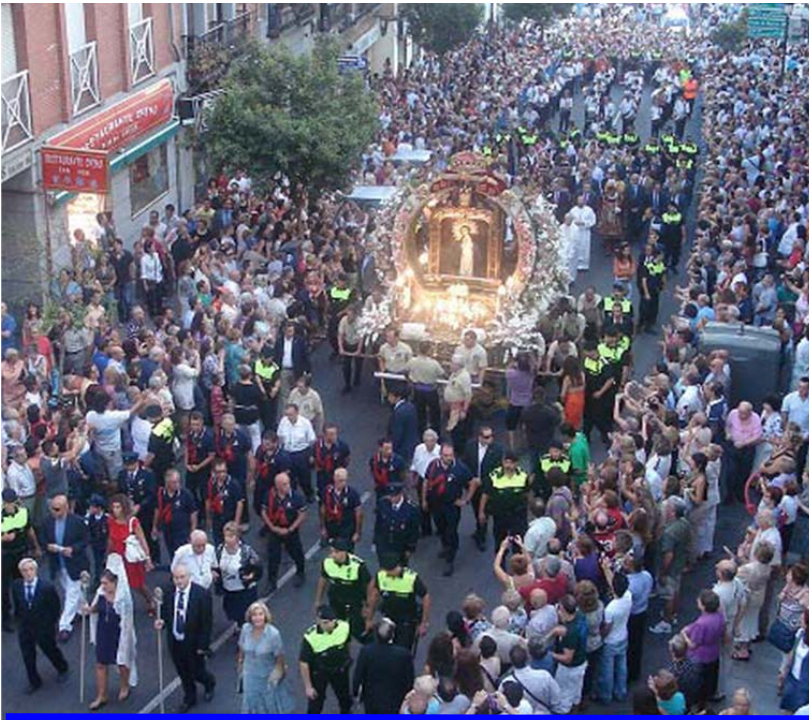
La procesión de La Paloma, atrae a miles y miles de fieles. En la fotografía, una panorámica del 15 de agosto de 2010.